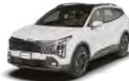
Snow White Pearl