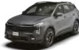
Shadow Matt Gray