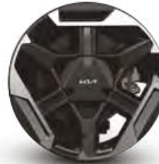
Rin de aluminio de 18" bitono