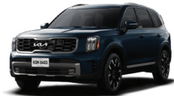
Midnight Lake Blue