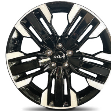
Rin de aluminio de 20" bitono