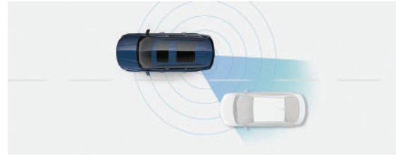
Asistencia de prevención de colisión en el punto ciego (BCA)

Gracias a su cámara frontal y radar, el sistema puede detectar un vehículo, peatón o ciclista que se encuentre delante. También funciona al cruzar o girar en una intersección y al cambiar de carril.