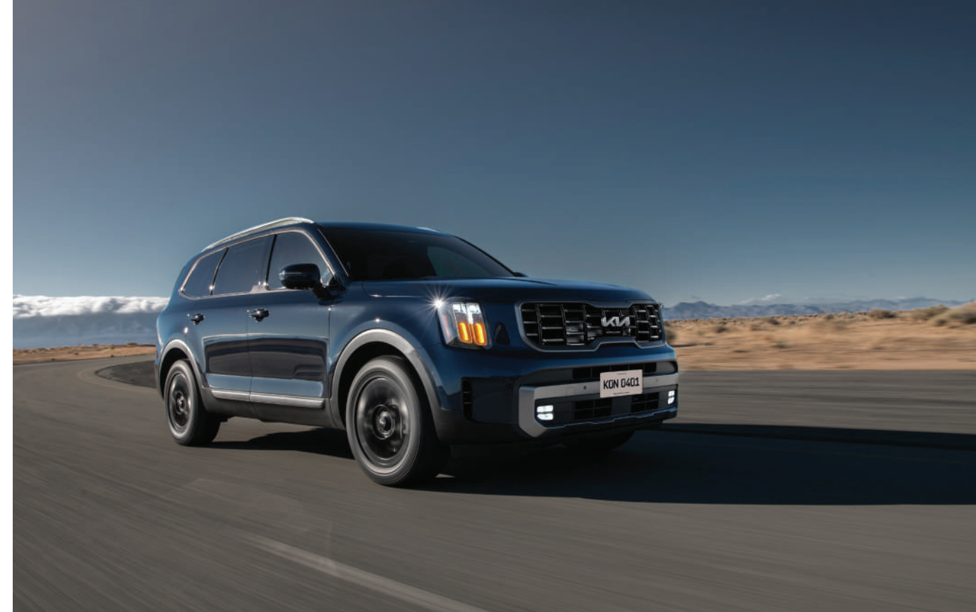
9 bolsas de aire

Ayuda a mantener la distancia con el vehículo de enfrente y a conducir a la velocidad que establezcas. Telluride se detiene automáticamente y, si la pausa es breve, también puede reanudar su marcha de forma automática.