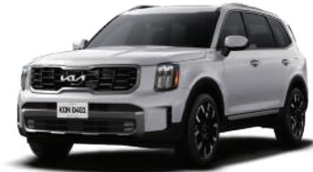
Glacial White Pearl